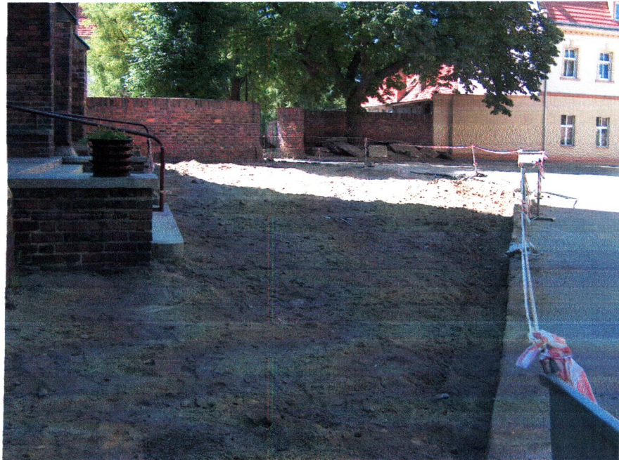
fot. 3 Odsłonięta powierzchnia w części objętej nadzorem. Widok od północy