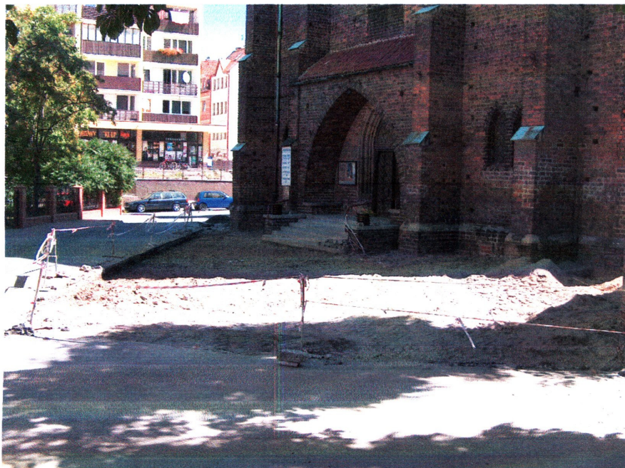
fot. 4 Odsłonięta powierzchnia w części objętej nadzorem. Widok od południowego zachodu