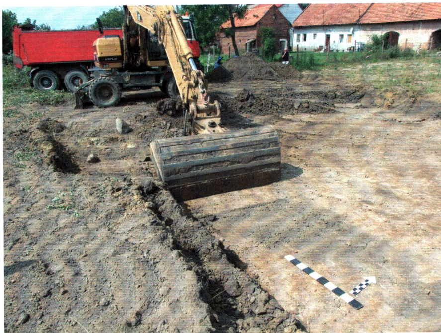
fot. 1 Nadzór nad pracami ziemnymi w południowej części inwestycji