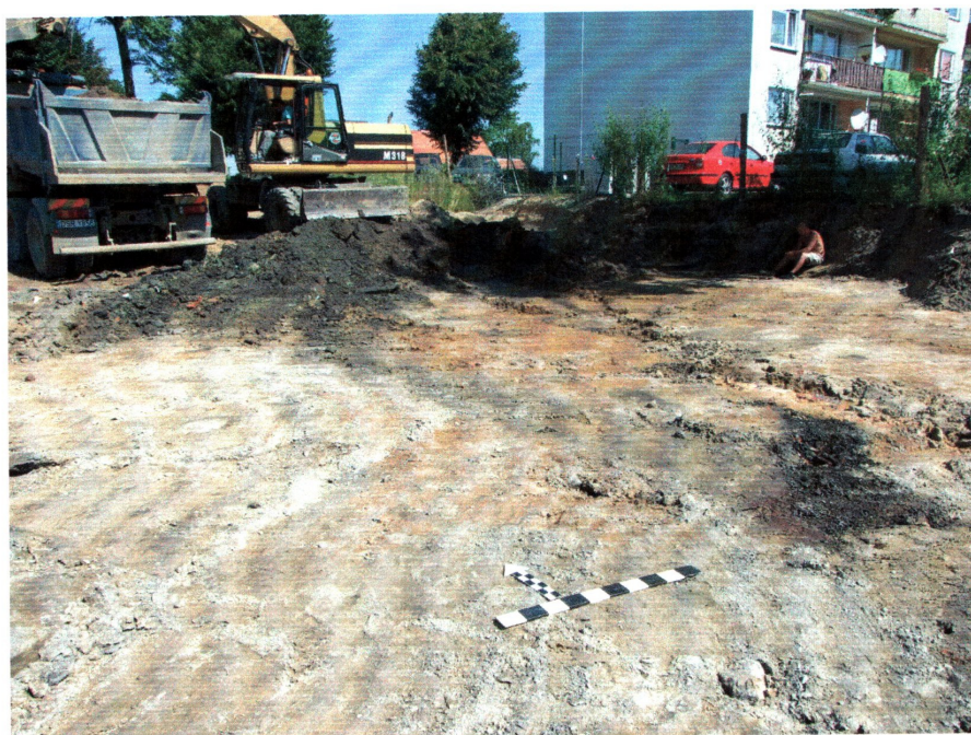
fot. 2 Nadzór nad pracami w środkowej części inwestycji