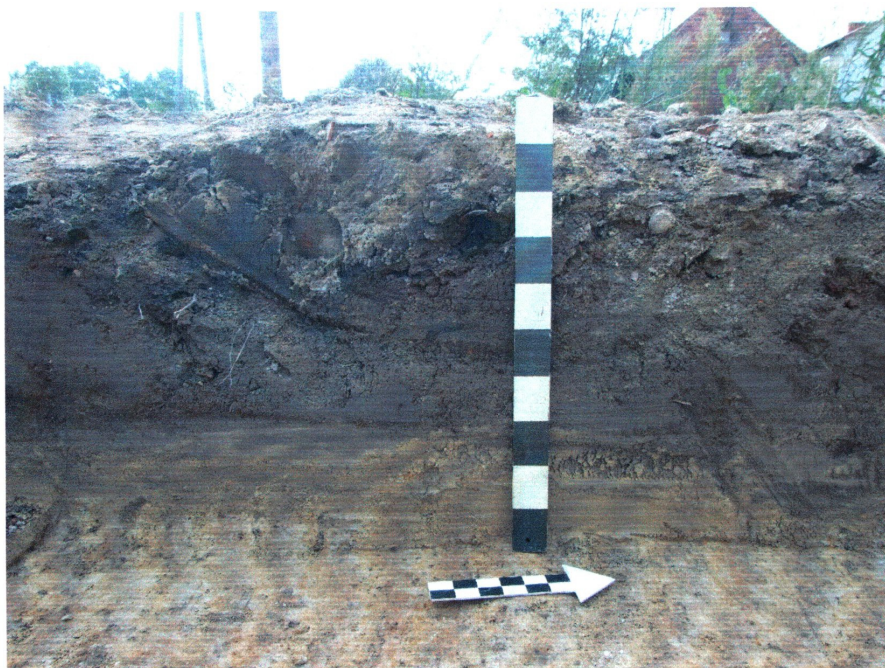
fot. 4 Układ nawarstwień zarejestrowanych w profilu 1 (E)