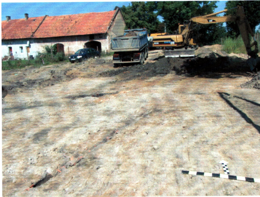
fot. 3 Nadzór nad pracami w północnej części inwestycji