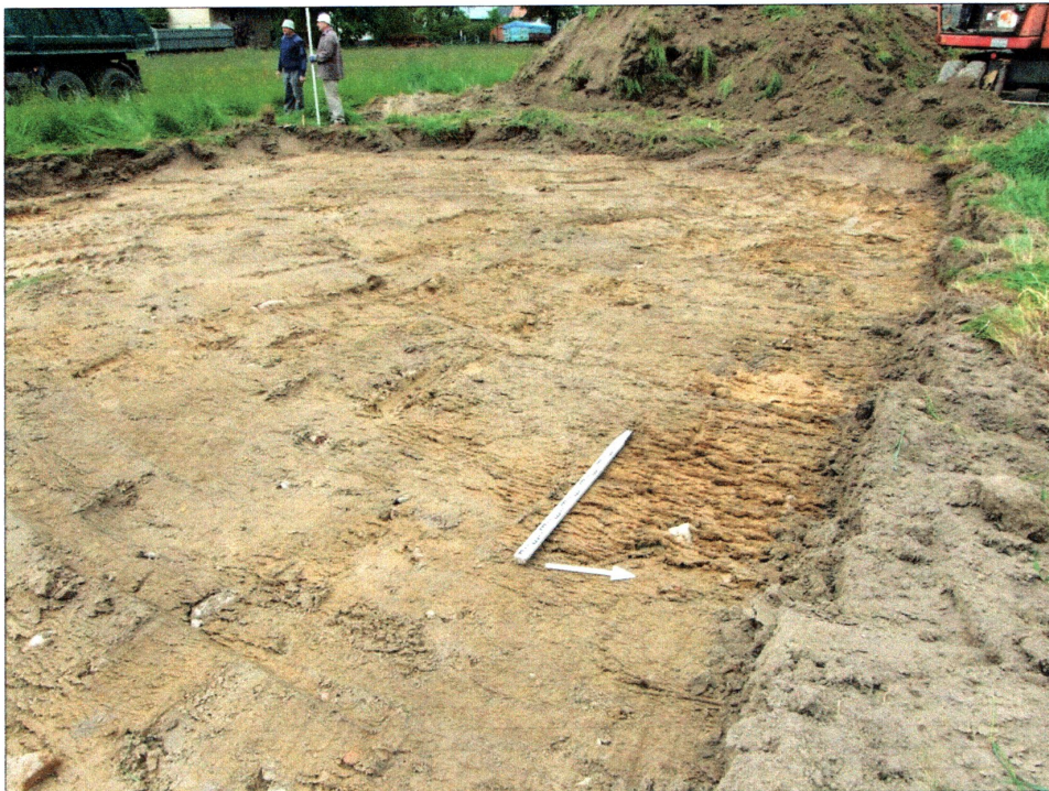
Fot. 3 Odhumusowany teren pod budynek mieszkalny, widok od strony wschodniej