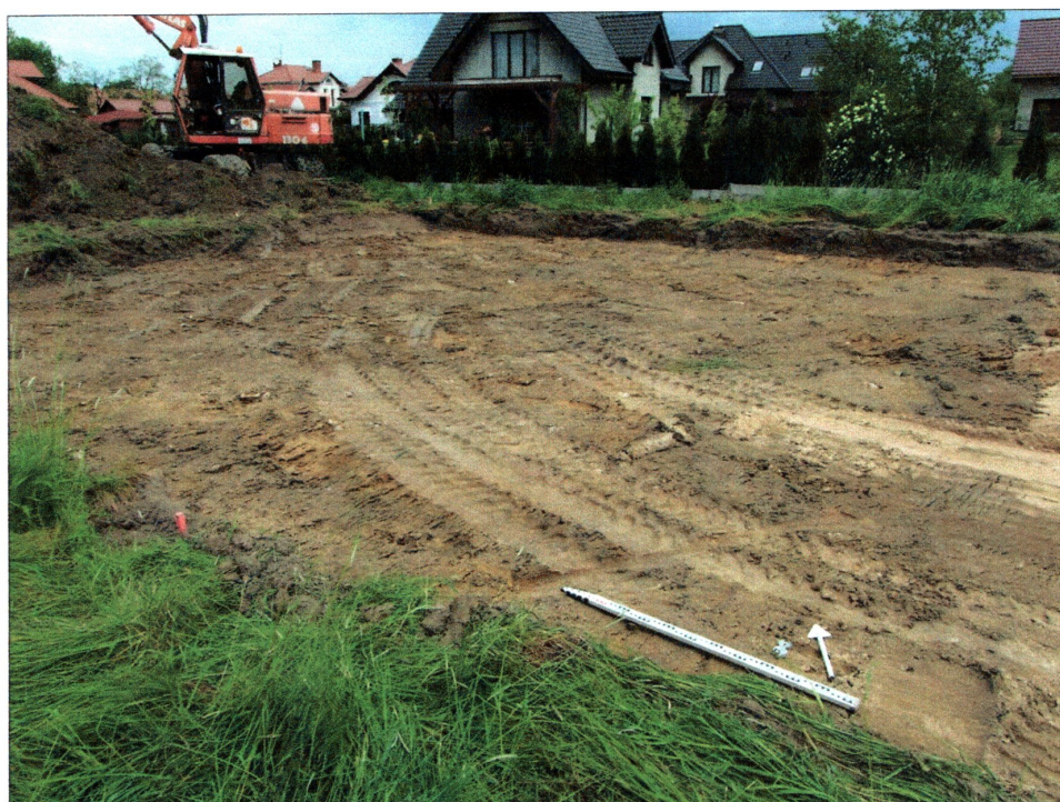
Fot. 2 Odhumusowany teren pod budynek mieszkalny, widok od strony południowej