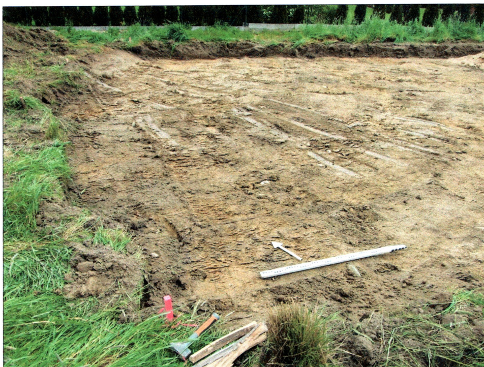
Fot. 4 Odhumusowany teren pod budynek mieszkalny, widok od strony południowej