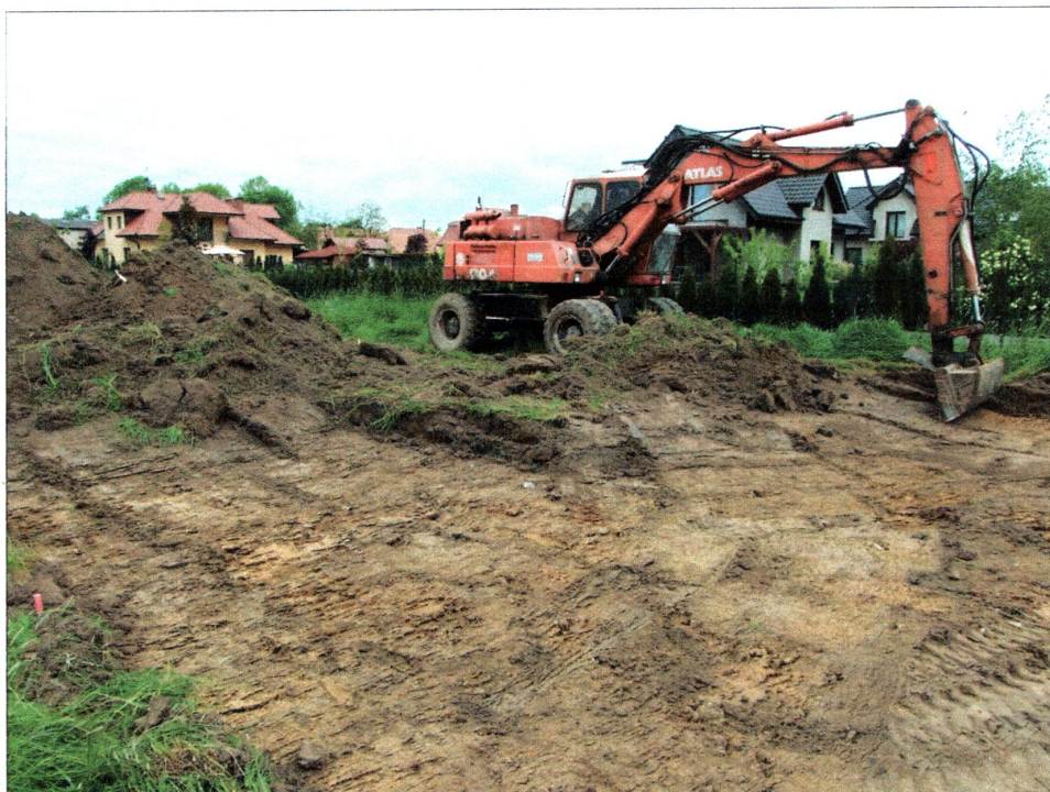
Fot. 1 Nadzór nad pracami przy odhumusowywaniu terenu pod budynek mieszkalny