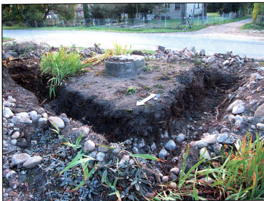
fot. 2 Wykop powstały po demontażu fundamentów ogrodzenia