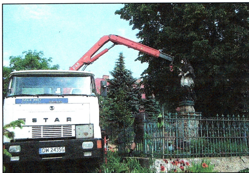
fot. 1 Figura św. Jana Nepomucena w trakcie demontażu