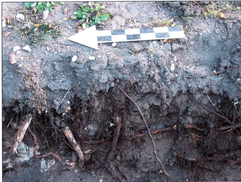
fot. 4 Fragment ścian wykopów powstałych po demontażu fundamentów ogrodzenia