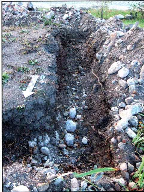
fot. 3 Wschodnia część wykopów powstałych po demontażu fundamentów ogrodzenia