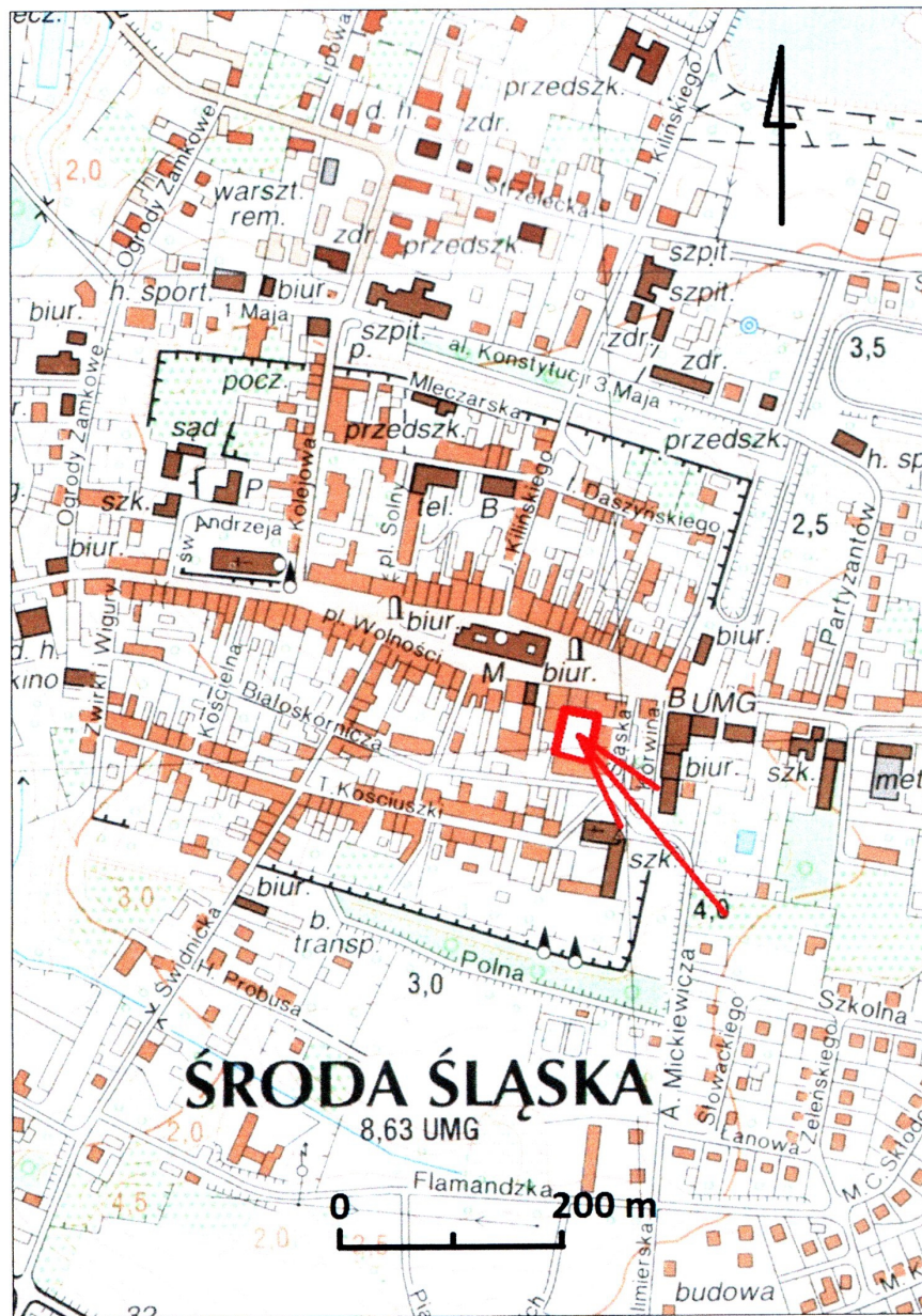
ryc. 1 Lokalizacja terenu inwestycji