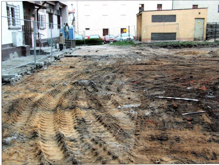
fot. 1 Teren inwestycji – widok od strony wschodniej