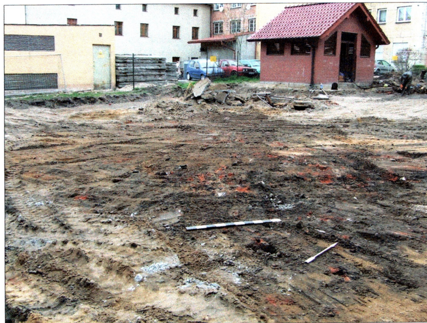
fot. 2 Teren inwestycji – widok od strony południowo-wschodniej