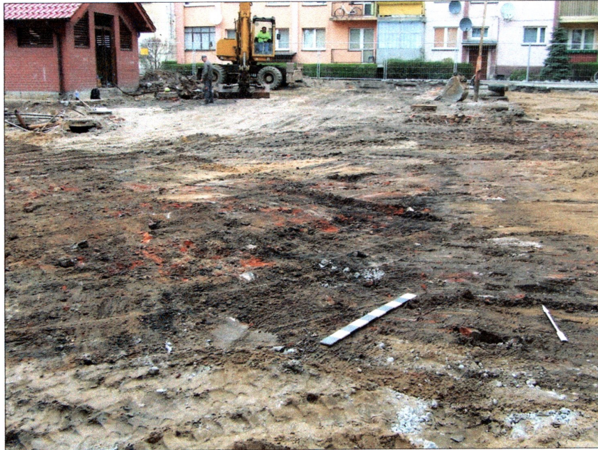
fot. 3 Teren inwestycji – widok od strony południowej