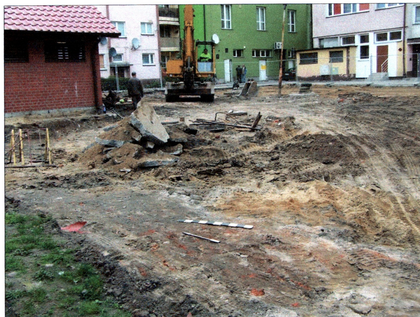
fot. 4 Teren inwestycji – widok od strony południowo-zachodniej